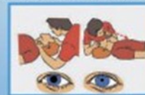
5. Освободить носовую полость на носовых ватных жгутиках, удалить заложенные предметы из носовой полости пострадавшего.

Уложить пострадавшего животом на свое колено, дать возможность дышать легким путем. Обеспечить проходимость верхних дыхательных путей. Очистить полость рта от посторонних предметов (глина, рвотные массы и т.д.).