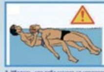
3. Убедись, что тебе ничего не угрожает. Избегай пострадавшего из воды. (При подходе к потерпевшему на переднем положении - выталкивай пострадавшего на доску или широкую лодку)