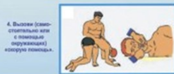
4. Вызови (самостоятельно или с помощью окружающих) скорую помощь.