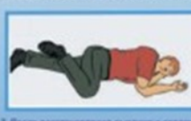
7. После восстановления дыхания и сердечно-легочной деятельности травмы пострадавшему установить безболезненное положение. Уложить и закрыть рот. Обеспечить постоянный контроль за состоянием пострадавшего.