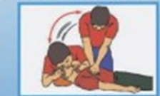
6. Если уши, дышательный аппарат и респиратор закрыты на свет, очистить - немедленно приступить к сердечно-легочной реанимации. Приложить реанимацию до прибытия медицинского персонала или до восстановления самостоятельного дыхания и сердечной деятельности.