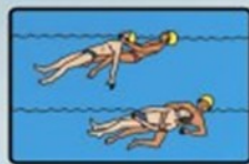
2. Первая помощь пострадавшему в воде